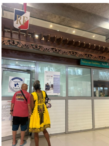
Une avocate et un bénévole habilité à entrer en ZA refusés par la PAF

Leur expulsion a pu être suspendue, à 10 minutes du décollage, grâce à l'intervention d'un collectif de 4 avocat.e.s, et à la mobilisation des médias et des associations.